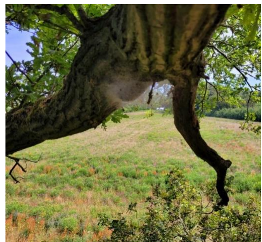
Abbildung 1: Gespinnstnest des Eichenprozessionsspinners an einer Blühfläche.

Blühende Waldränder stellen normalerweise einen idealen Lebensraum für Insekten dar. Wenn die Anlage von Waldrändern allerdings nicht möglich ist, können Ackerrandbegrünungen bzw. Blühflächen auf landwirtschaftlichen Flächen, die an Eichenbestände und Eichenalleen angrenzen, als Lebensräume für diese Gegenspieler dienen (Abb. 1). Das Projekt „Blühmasse“ des Vereins „Nachhaltiger Westen e.V.“ im Münsterland fördert die Anlage solcher Blühflächen zur Biogasgewinnung, als Alternative zu Maisanbau. Das Team Wald- und Klimaschutz hat dort mit der Unterstützung des Vereins eine Untersuchung der Schlupfrate von EPS-Faltern