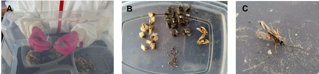
Abbildung 2: A) Untersuchung der Gespinstnester und B) Sortierung der Funde nach der natürlichen Flugperiode. C) Geschlüpfte parasitierende Schlupfwespe.

durchgeführt, um herauszufinden, ob sich Blühflächen als Bekämpfungs- bzw. Präventivmaßnahme gegen den EPS eignen. Dafür wurden Gespinstnester an Blüh- und Kontrollflächen eingesammelt und auf die Anzahl der geschlüpften Falter und Gegenspieler hin untersucht (Abb. 2).